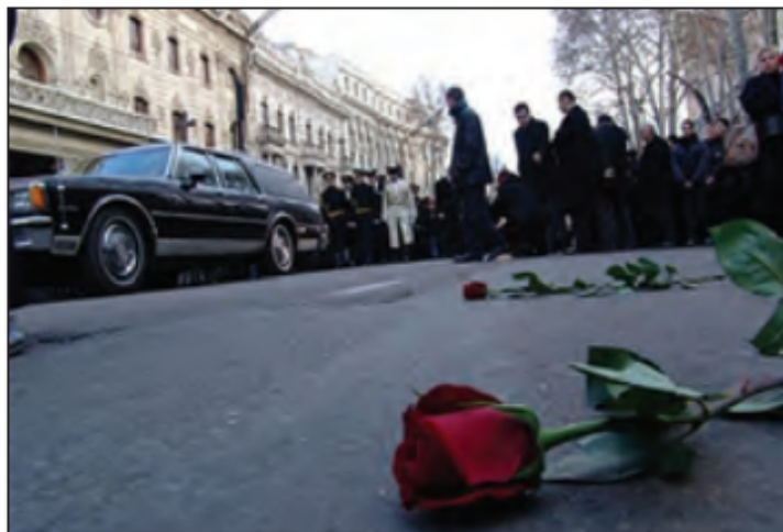
■ انقلاب گل سرخ در گرجستان

انقلاب‌هایی که با استفاده از قدرت نرم رسانه‌ها در صدد براندازی حکومت‌های مخالف غرب برآمدند، انقلاب‌های رنگین نام گرفتند. در مورد این انقلاب‌ها و همچنین نحوه استفاده از شبکه‌های اجتماعی با هدف براندازی یک حکومت و شکل دادن به «انقلاب‌های رنگین» گفت و گو کنید.