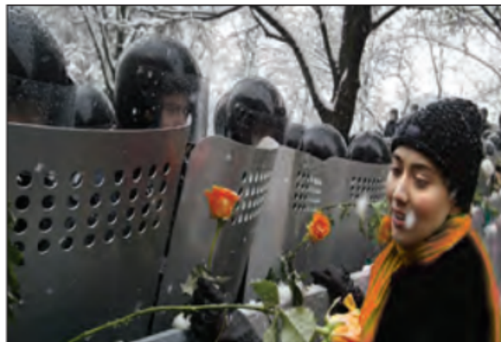
■ انقلاب نارنجی در اوکراین